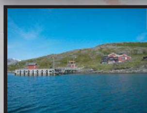
Sørøya Gjestestue N-9664 Sandøybotn www.gjestestua.no