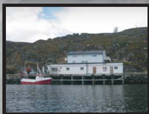
Kokelv Sjøhus N-9715 Kokelv www.kokelv-sjohus.no