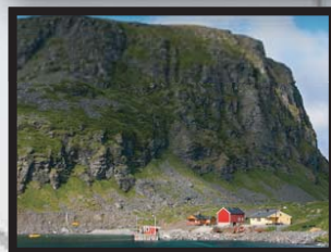
Anemone - N-9657 Kårhamn www.anemoneyc.com