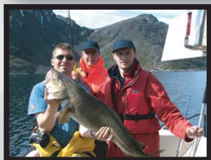
Seiland Explore N-9609 Hølseby www.seiland-explore.no